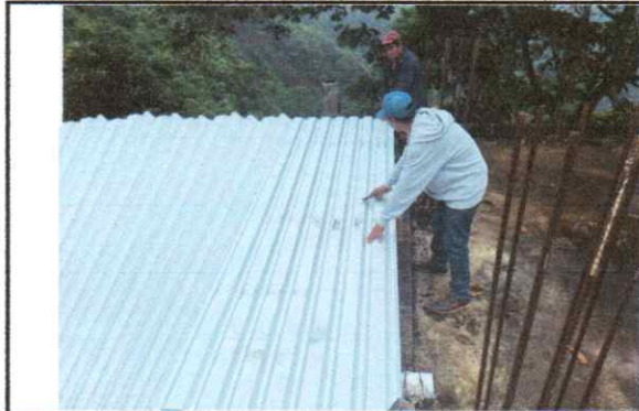
Foto1: Cubiera de lamina