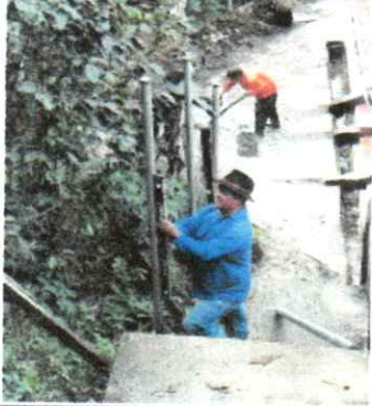
Foto7: Muros perimetrales