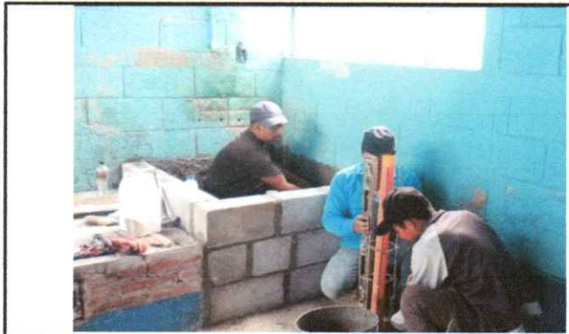
Foto 4: Reparación de cocina, sustitución de pila de cemento de un lavadero