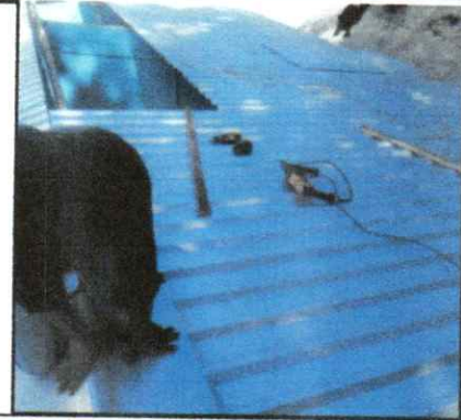
Foto 8: sustitución de laminas acanaladas y o troqueladas en el aula

Observación: Si es necesario se pueden agregar hojas adicionales, regular el número de hojas.